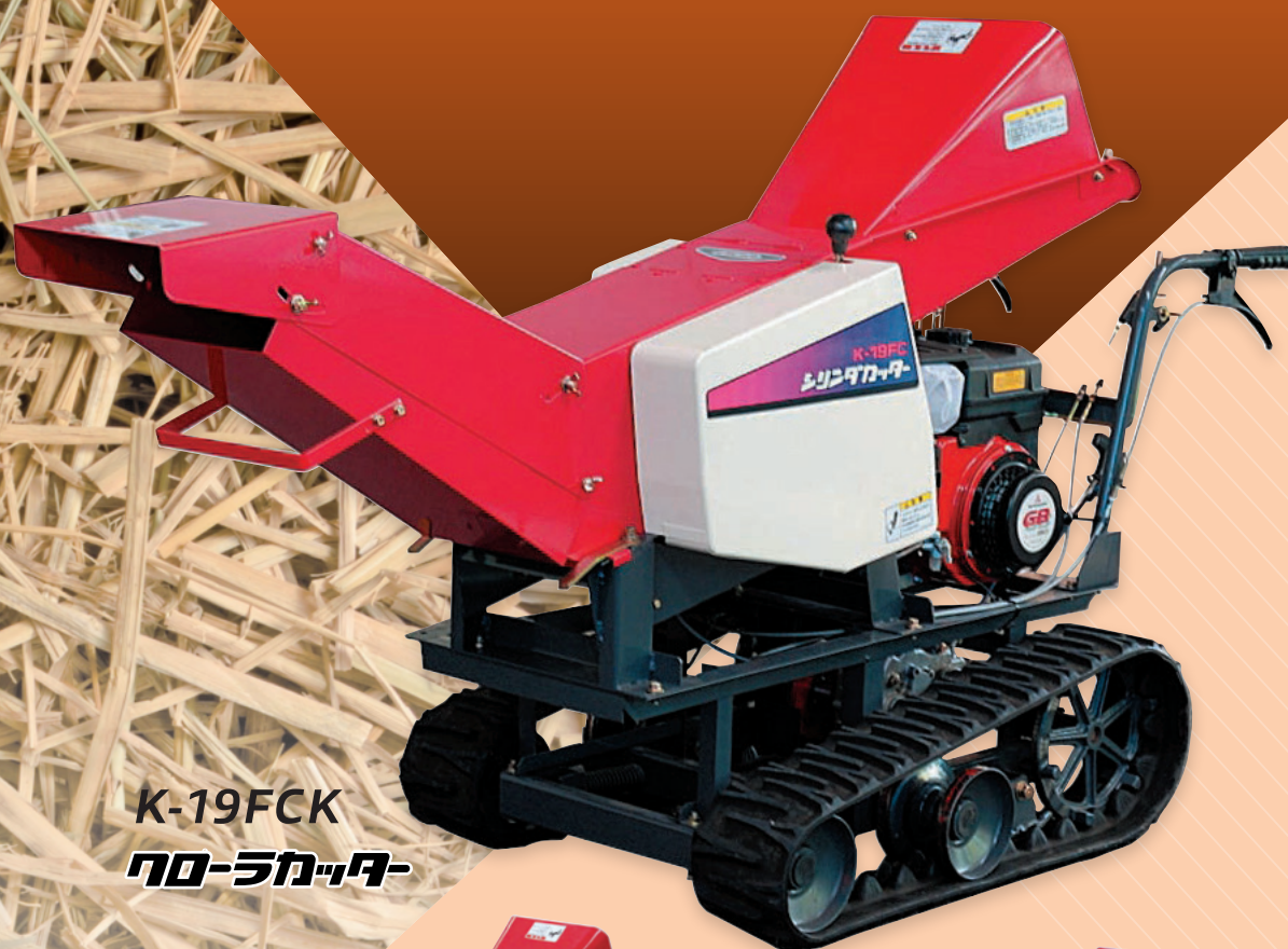
K-19FCK トラクタカッター