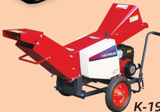
K-19FCT キャリアカッター