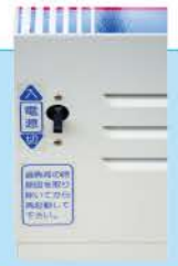
【組合せ例 GB-3+石抜精米機PS100】

⑤ブレーカ兼用スイッチ採用で、トラブルを未然に防ぎます。お米の袋が一杯になった状態で運転を続けると機械が自動停止しますが、お米の袋を取替えれば、すぐに再起動し、機内のお米を除去する必要がありません。